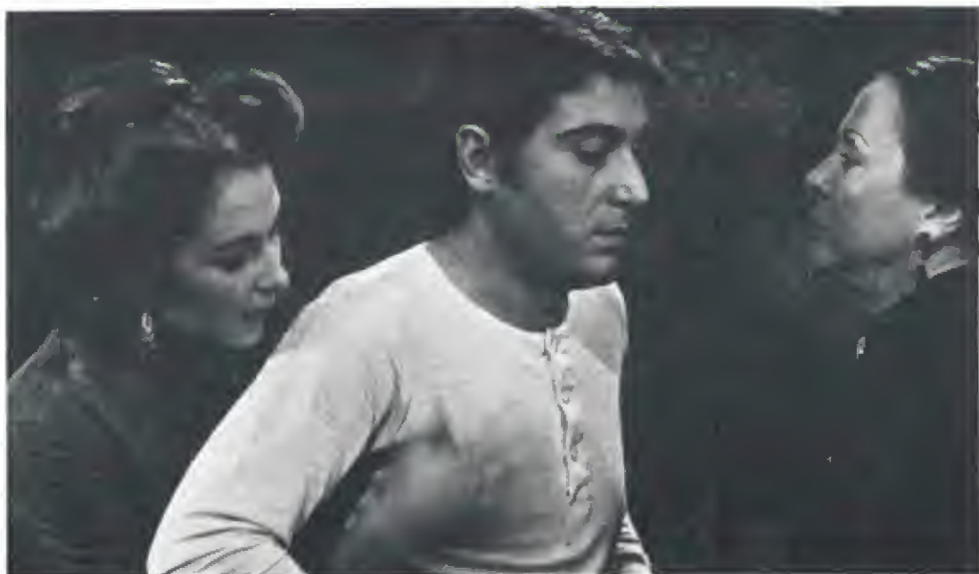
Adriana Vega – Andrés Pajares – María Luisa Ponte